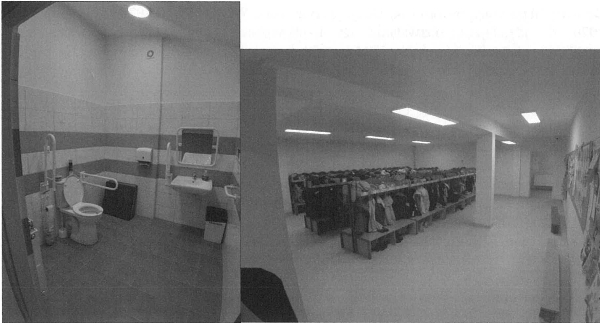
Łazienka z usprawnieniami dla osób z trudnościami, szatnia