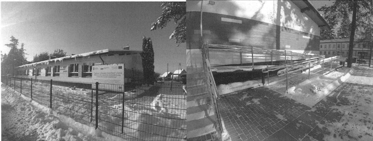
Budynek przedszkola w Czarnej Białostockiej, elewacja, podjazd dla wózków, tablica pamiątkowa