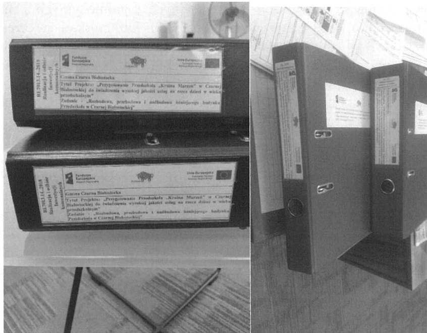
Segregatory, w których przechowywana jest dokumentacja dotycząca projektu