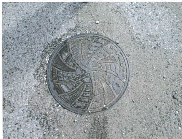
Elementy kanalizacji sanitarnej