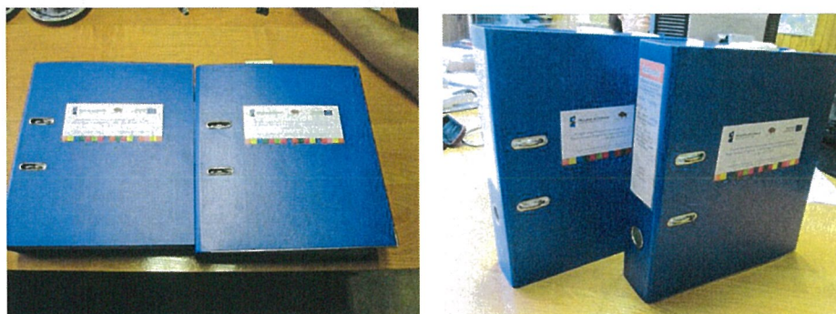
Segregatory z dokumentacją projektu

4. W trakcie kontroli przypomniano Beneficjentowi o obowiązku przechowywania wszystkich dokumentów związanych z zrealizowanym Projektem w celu zachowania wystarczającej ścieżki audytu (śladu rewizyjnego). Brak dokumentacji umożliwiającej stwierdzenie zachowania ścieżki audytu przez kontrole przeprowadzane przez inne uprawnione instytucje może skutkować niekwalifikowalnością wydatków jako niewłaściwie udokumentowanych.