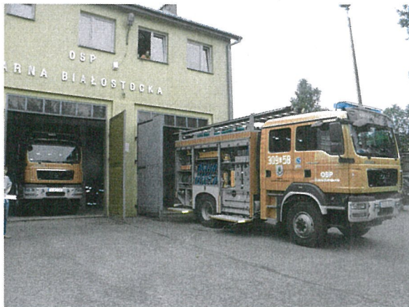
Dwa specjalistyczne wozy strażackie z wyposażeniem