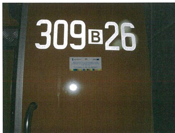
Tabliczki informacyjne umieszczone na wozach strażackich